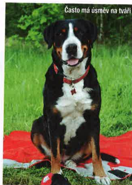
Často má úsměv na tváři

Velký švýcar je krátkosrstý, a tak péče o srst je zcela minimální, což je oproti jeho dlouhosrsté varietě, Bernskému salašnickému psovi, velká